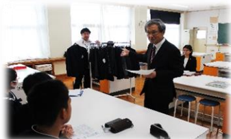
Pagpapaliwanag ng layunin ng Pangulo

Sa panahon ng 'pagtalakay na pulong,' ang mga kinatawang estudyante ay lumapit sa kaganapan na may matinding interes at sigasig. Mayroong maingat na pagsusuri sa mga kumbinasyon ng mga kulay, pati na rin ang paghahambing at pagsasaalang-alang sa pagitan ng mga pattern at solid.